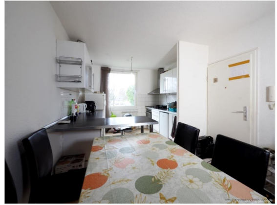
Essbereich mit Küche